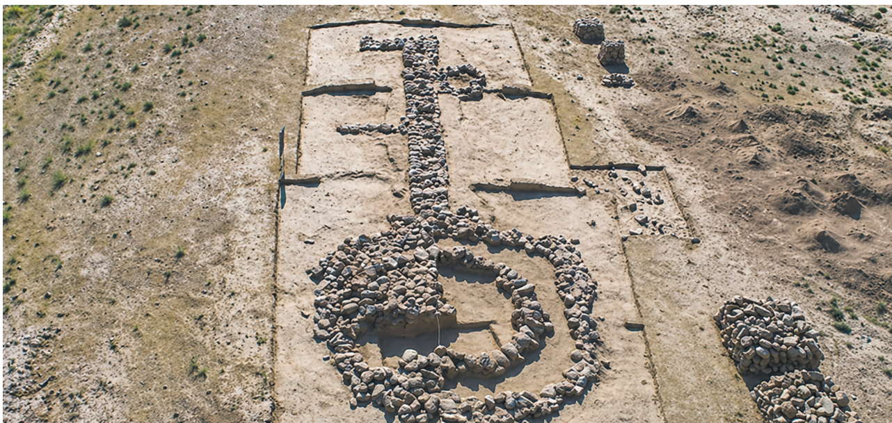
3-rasm. Kayrit dahmasi (Kd_01_003 va Kd_01_004). Aerofoto