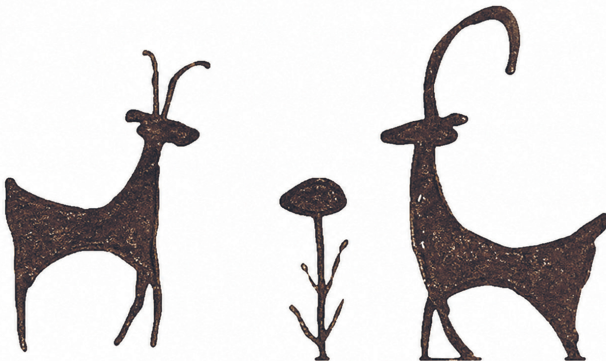
2-rasm. Jarqo'ton slindr muhr gardishidagi tasvir. (Мейтарчян, 1984. С. 41-45).

etib. Haomaning ijobiy tavsifi - haoma – hushyorlik, tiyraklik bag'ishlaydigan muqaddas ichimlik bo'lib, efedra o'simligidan ham tayyorlangan. Hushyor turib, chuqur idrok va hissiyot bilan ibodat qilish muhim sanalgan. Chunki zardushtiylik ta'limotiga ko'ra, "iroda erkinligi" ruhiy olamining kulminatsion nuqtasi hisoblanadi 1 . O'zbek va rus tillaridagi tarjimalarga haoma Yasht qismi mavjud bo'lib 2 , klassik tarjimonlarning yozma manbalarida haoma Yashtga duch kelinmaydi, chunki Yasht nasklarining asosiy talabi bo'lgan "karde" lar (o'Ichov birligi hisoblanadi) ga mos bo'lmaganligi sababli, Yasnanning tarkibiy qismiga qoldirishni afzal ko'rganlar 3 .