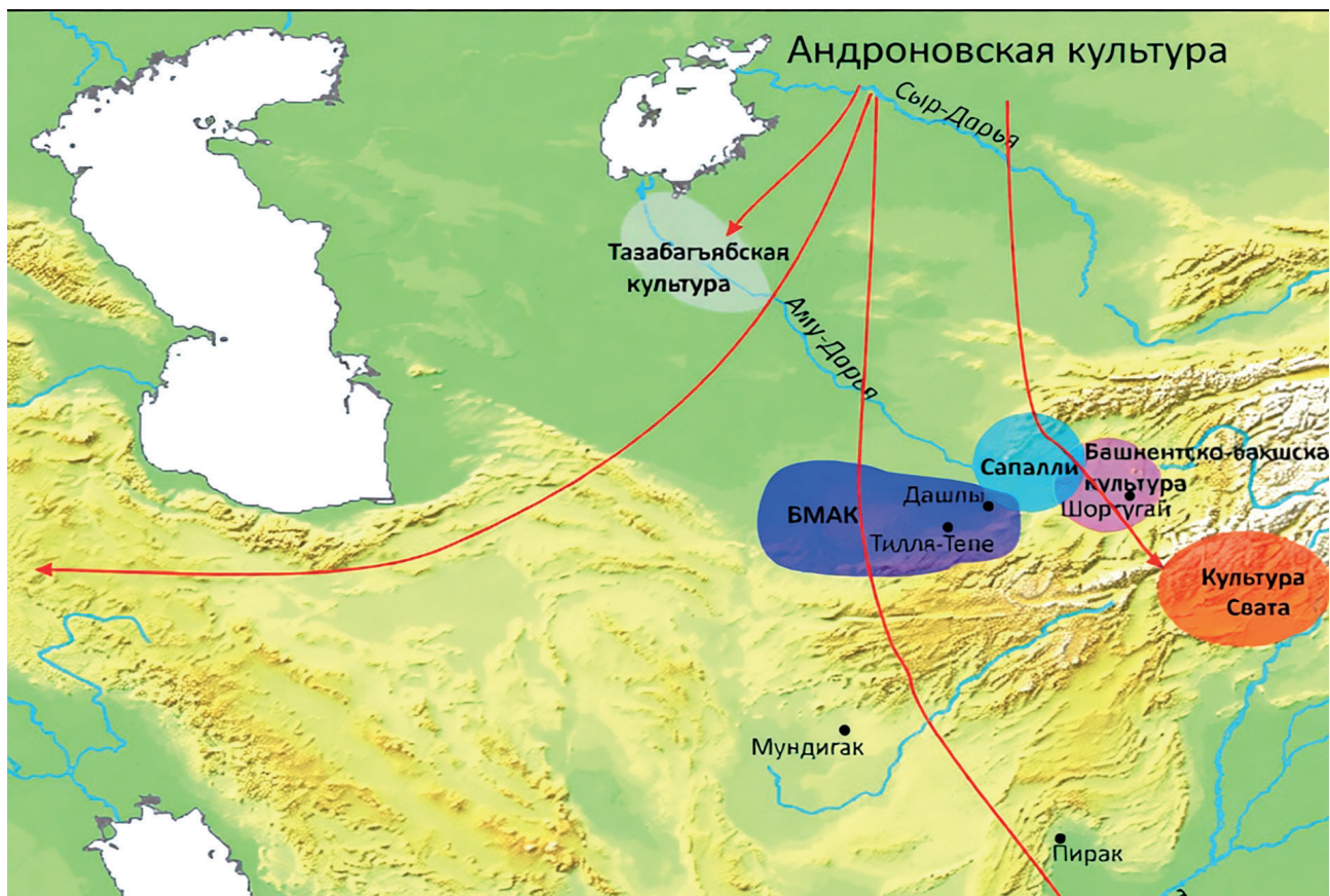
1-rasm. Bronza davrida ariylar migratsiyasi (Григорьев С.А. Происхождение и миграции индоариев [научное сетевое издание]: монография. – Челябинск: Изд-во Челябинского государственного университета, 2024. – С. 35, Рис. 1.)

ylarning kelib chiqishini dasht hududiga emas balki Eronga bog'lashi va tarixian ota-bobolari yurtiga qaytganligi haqidagi fikrlari biroz shubha tug'diradi va ilmiy jihatdan munozarali (1-rasm).