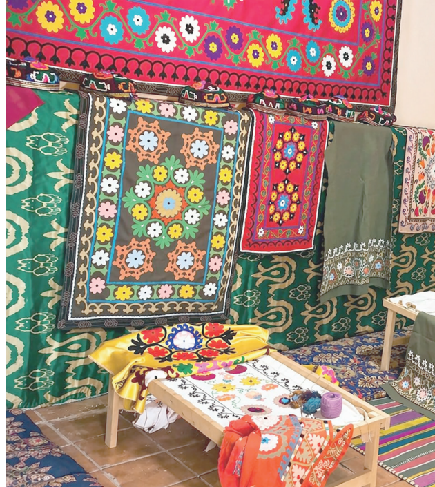
3-4-5 rasmlar. Boysun kashtalarining libos va buyumlardagi jozibasini.